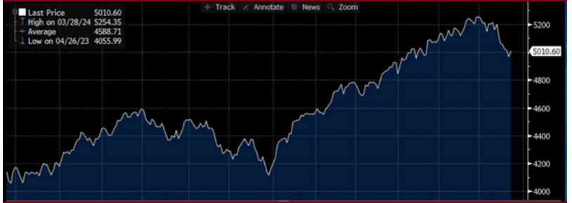
Qrafik: S&P500 İndeksi